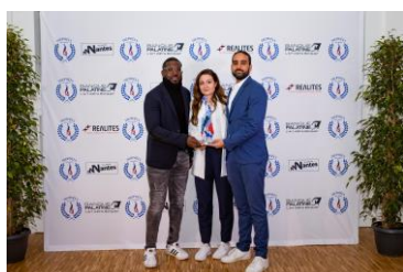
Trophée de l'Association en partenariat avec l'Agence Nationale du Sport