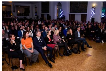
Assemblée de la cérémonie