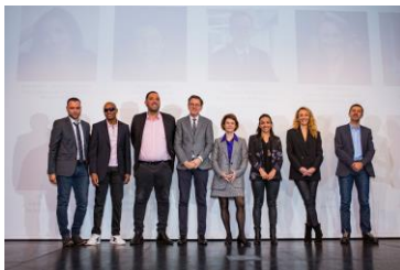
Membres du jury Alice Milliat