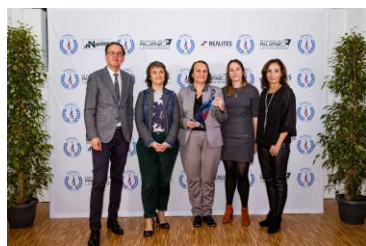
Trophée du partenaire du sport en partenariat avec Sporsora