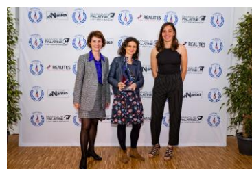
Trophée « Coup De Cœur » en partenariat avec le Collectif Alice Milliat