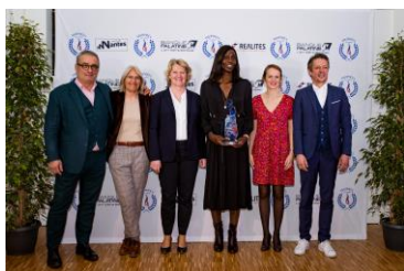
Trophée de la personnalité en partenariat avec Sport et Citoyenneté