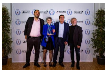
Trophée de l'Association Locale en partenariat avec l'Office Municipal des Sports de Nantes